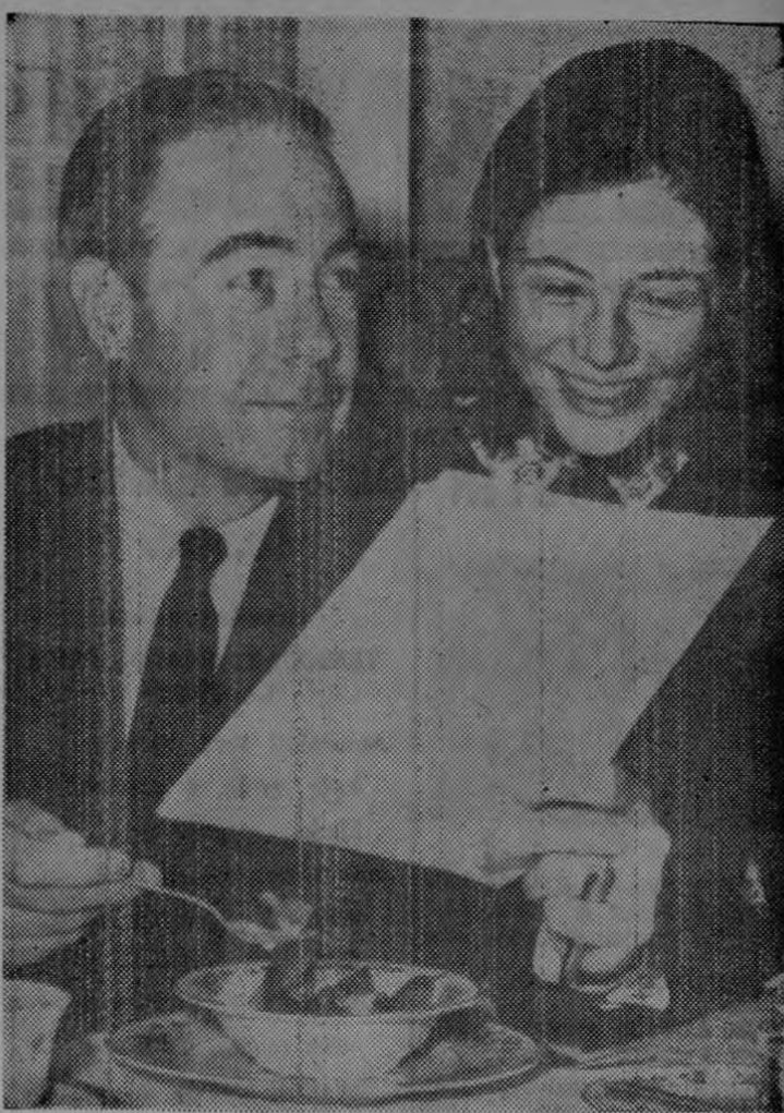
INDIANTOWN GAP, Pensilvania, junio 13 (AP).—El gobernador de Pensilvania, William W. Scranton es visto durante el desayuno en su mansión aquí hoy revisando el discurso que pronunciará en la convención republicana del Estado de Maryland. Su hija, Susan, de 18 años de edad, observa. (WIREPHOTO "AP" exclusiva de LA PRENSA LIBRE).

Policías de la ciudad y tropas del Estado fueron situadas por toda la zona.